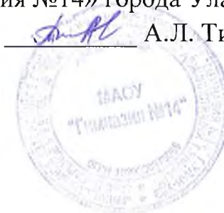
График оценочных процедур на 2023-2024 учебный год